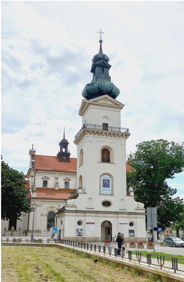
Widok dzwonnicy i katedry

Następnie mineliśmy pięknie odrestaurowaną Bramę Szczebrzeską . Witawa ona dostojnych gości wjeżdżających do Zamościa od strony zachodniej.