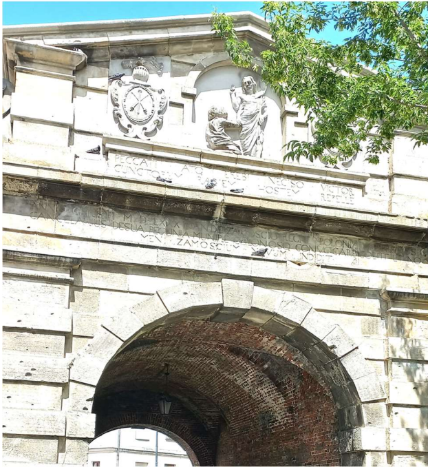
Stara Brama Lwowska