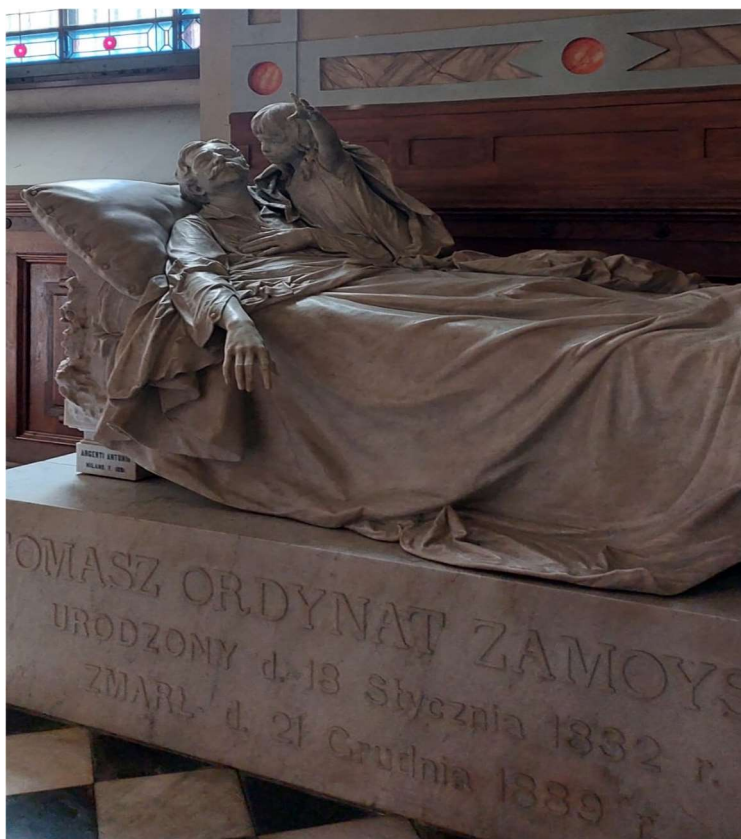
Nagrobek ordynata Tomasza Zamoyskiego

Obok świątyni znajdują się zabytkowa dzwonnica oraz Infułatka , czyli dom dziekanów zamojskich, gdzie mieści się Muzeum Sakralne Katedry Zamojskiej.