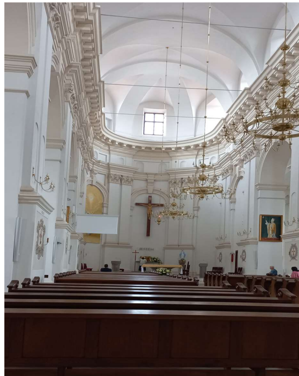
Nawa główna kościoła

Nasza trasa wycieczkowa powoli zmierzała w kierunku ryнку . Nie bez kozery jest on nazwany Wielkim - jego powierzchnia obejmuje aż jeden hektar. Wkrótce naszym oczom ukazał się skąpany w słońcu, rozległy plac, o kształcie idealnego kwadratu (100x100 m), z pięknym ratuszem . O dziwo, nie jest on usytuowany w punkcie centralnym. Tę tajemnicę wyjaśniła nam Pani przewodnik. Fundator i założyciel miasta uważał, że znajdujący się w pobliżu pałac Zamoyskich nie może być przysłonięty bryłą ratusza. A nie jest ona mała - posiada trzy kondygnacje i wieżę wysoką na 52 metry. Gmach zbudował Morando w XVI wieku. Dwuskrzydłowe, monumentalne schody, dobudowane w XVIII w., zdają się obejmować cały plac.