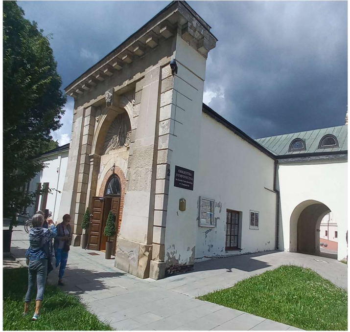
Nowa Brama Lwowska

Powoli zmierzaliśmy w kierunku starego miasta.