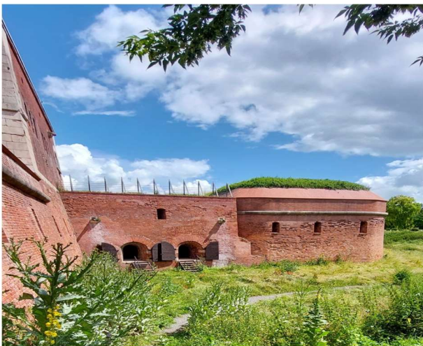
Fragment bastionu VII

Dlatego, wybudowanie potężnych murów obronnych, miało istotne znaczenie dla bezpieczeństwa miasta Twierdza Zamość , to jedna z najpotężniejszych i najnowocześniejszych twierdz w okresie Rzeczypospolitej Obojga Narodów i Księstwa Warszawskiego. Posiadała siedem bastionów, zaopatrzonych w działa, które skutecznie broniły miasta m.in. przed wojskami kozackimi Chmielnickiego, w czasie potopu Szwedzkiego czy najazdu bolszewickiego. Wielokrotnie modernizowana przez wybitnych fortyfikantów, po powstaniu listopadowym zaczęła jednak tracić swoje znaczenie i ostatecznie została zlikwidowana, a mury częściowo rozebrano. Prace nad odbudową fortyfikacji rozpoczęto jeszcze w latach dwudziestych ubiegłego wieku. W 2015 roku skończono długoletnią rewitalizację obiektu. Dzięki ogromnym inwestycjom udało się odtworzyć liczne mury i budowle obronne w tym potężny bastion VII, Arsenal gdzie mieści się ekspozycja broni i Rotundę przeznaczoną na Muzeum Martyrologii. Na dużej części terenów pofortecznych utworzono planty i park miejski.