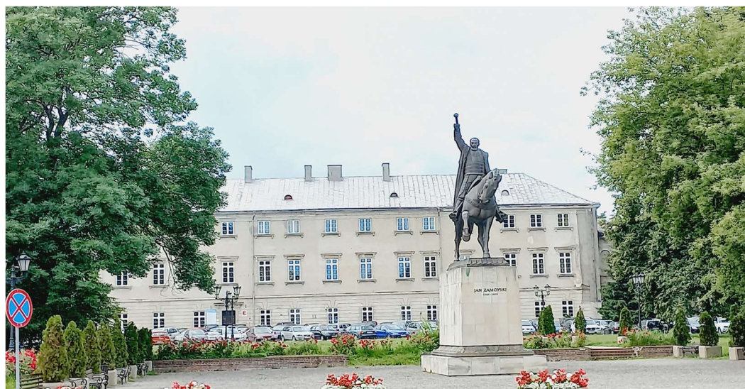
Pomnik hetmana Jana Zamoyskiego, w tle rezydencja założyciela miasta

U wylotu ulicy Grodzkiej zobaczyliśmy monumentalny pomnik. Jak się okazało, to sam Jan Zamoyski na koniu. Spogląda na swoje piękne miasto i rzesze turystów podziwiające to wyjątkowe miejsce. Za nim widoczny jest Pałac Zamoyskich , który niestety, niewiele zachował z dawnej postaci. Wielokrotnie przebudowywany, zmieniał swój styl od renesansowego przez barokowy po klasycystyczny i trudno uznać go dziś za zabytek.