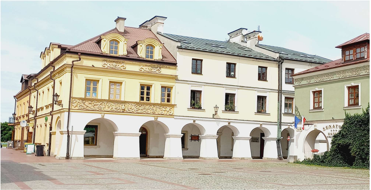
Kamienica z podcieniami przy Rynku Solnym. Dawny dom rabina

Jan Zamoyski wiedział, że prężnie działający handel oznacza bogate miasto. Stworzył korzystne warunki dla osadnictwa najlepszych kupców i rzemieślników. I tak w Zamościu, pojawili się, pochodzący z Hiszpanii, Żydzi sefardyjscy, którzy otrzymywali status równy wszystkim mieszkańcom. Uzyskali zgodę na budowę synagogi, chederu (szkoły religijnej dla chłopców) oraz mykwy (łaźni rytualnej). Do dzisiaj zachowała się dawna synagoga wybudowana w 1610 roku w sercu dawnej dzielnicy żydowskiej. Jest jedną z najpiękniejszych bożnic żydowskich w Polsce, udostępniona turystom.