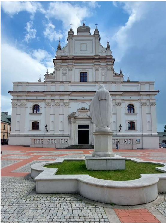
Kościół o.o. Franciszkanów

zobaczyć ekspozycje związaną z obyczajami towarzyszącymi pochówkom, głównie w okresie baroku.