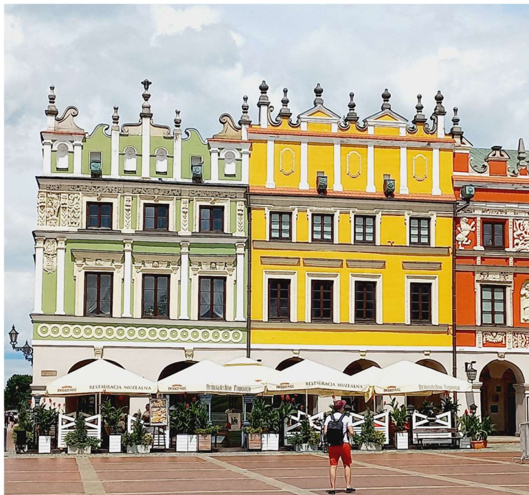
Kamienice „ormiańskie” przy Rynku Wielkim.

Malownicze, podcieniowe kamienice o barwnych fasadach, z ozdobnymi attykami, które otaczają rynek, zamieszkiwali zamożni kupcy, profesorowie akademii i dworzanie. Należały do: Włochów, Żydów, Greków, Ormian, których do miasta przyciągnęły ulgi i przywileje jakie, dawał im hetman Zamoyski. Najbardziej urokliwe z nich, to kamienice „ormiańskie”- „Pod Aniołem”, „Pod Madonną” „Pod Małżeństwem”. Ich nazwy wywodzą się od zdobiących je płaskorzeźb. Obecnie mieści się tu Muzeum Zamojskie.