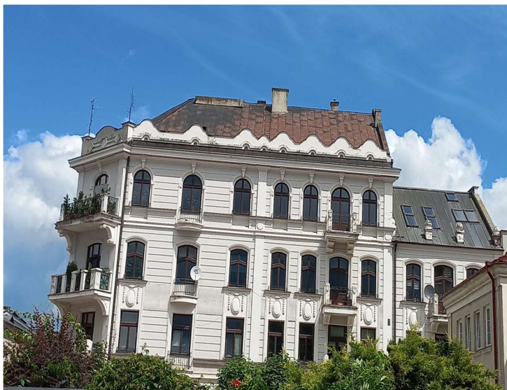
Dom Centralny „Centralka”

architektonicznym, ale i historycznym budynkiem, zwanym Centralką . Dom Centralny , w stylu secesyjnym, powstał przed I wojną światową. Mieściły się tu sklepy, biura, luksusowa restauracja a także Hotel Centralny. Nazwa budynku wiąże się z zainstalowaniem tu pierwszego w Zamościu centralnego ogrzewania. Przed II wojną światową mieszkał i tworzył tutaj - Bolesław Leśmian, a w czasie okupacji w gmachu znajdował się sztab żandarmerii niemieckiej.