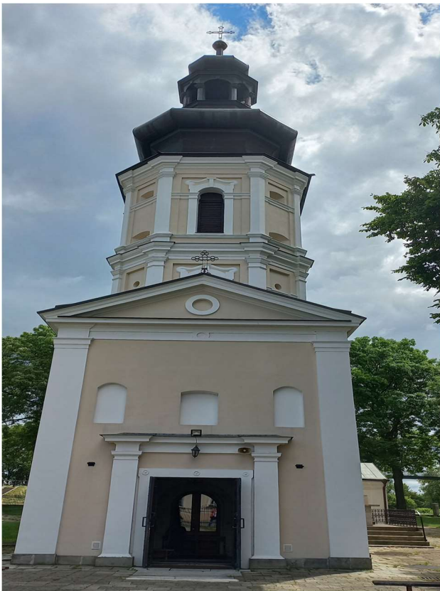
Kościół św. Mikołaja

Tuż przy murach dostrzegliśmy kościół św. Mikołaja. Jak się okazało to dawna cerkiew . Powstała dla greckich kupców ściągniętych przez Jana Zamoyskiego. Handlowali oni głównie winami i obok Ormian i Żydów stanowili ważną grupę cudzoziemców w mieście . Ponieważ świątynia zlokalizowana była przy fortyfikacjach, wieże jej wyposażono w otwory strzelnicze aby mogła pełnić dodatkowo jeszcze funkcje obronne. Obecnie służy jako kościół rzymsko-katolicki, którym opiekują się Redemptoryści.