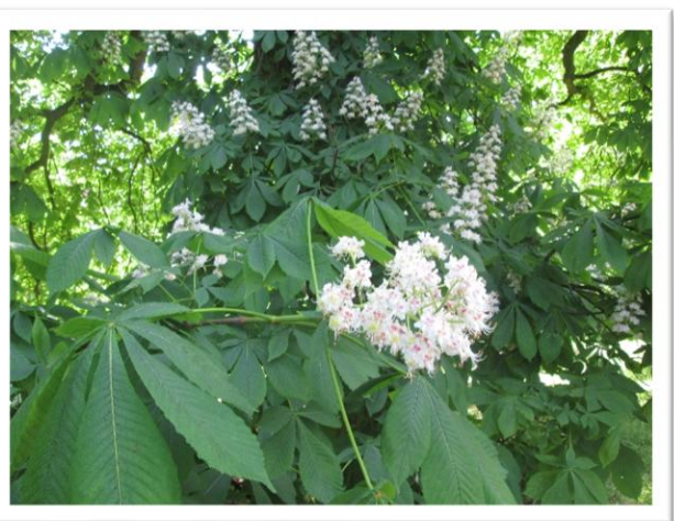
Arboretum - „żywe muzeum drzew”

Zamek w Gołuchowie to wyjątkowo piękny i cenny zabytek, a dzięki otoczeniu pięknym parkiem oraz sąsiadującemu Muzeum Leśnictwa stanowi obiekt zasługujący na więcej niż kilka godzin zwiedzania. Wycieczka była zachwycająca.