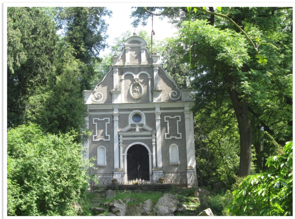
Mauzoleum Izabelli z Czartoryskich Działyńskiej

Izabela zmarła w 1899 roku i pochowana została w Głuchowie, w przebudowanej w tym celu kaplicy znajdującej się na terenie parku, blisko zamku.