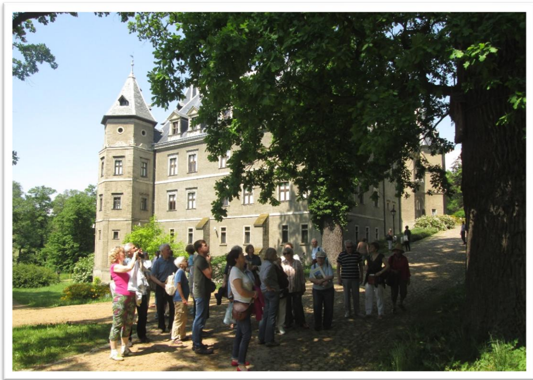
Uczestnicy naszej wycieczki w Gołuchowskim parku

W przerwie obiadowej zostaliśmy nakarmieni w restauracji „Muzealna” (w obrębie obiektu Oficyna). Restauracja jest ozdobiona licznymi „muzealnymi” eksponatami ptaków i zwierzaków.