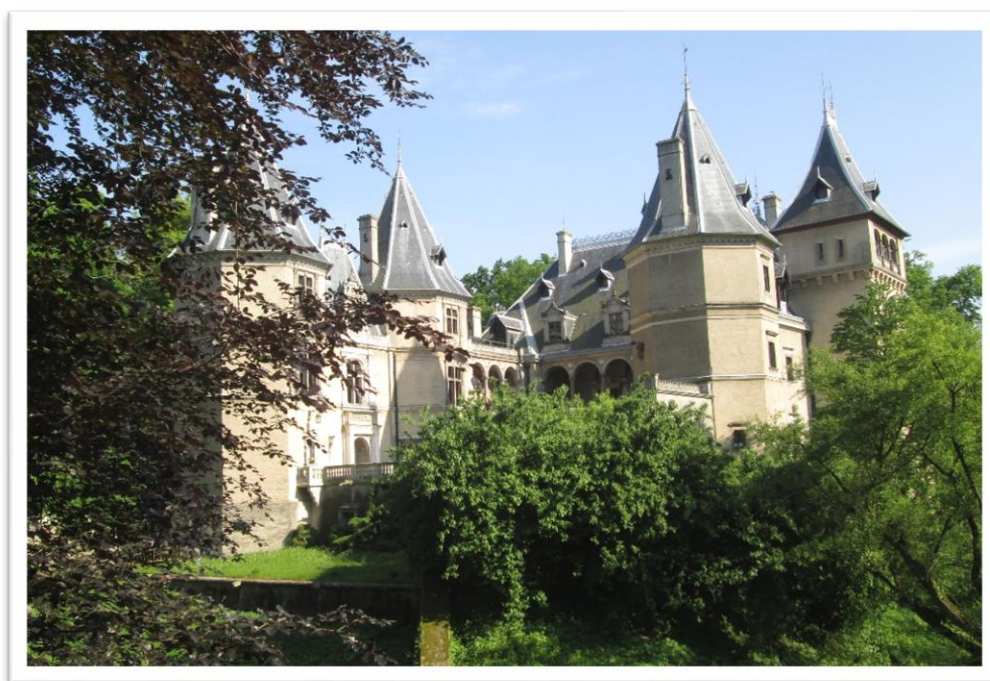
Zamek książąt Czartoryskich w Gołuchowie

Zamek to późnorenansowy dwór obronny wzniesiony około 1560 roku, rozbudowany przez Leszczyńskich na początku XVII wieku. W latach 1872-1875 staraniem hrabiny Izabeli z Czartoryskich Działyńskiej przebudowany z przeznaczeniem na prywatne muzeum. Pierwowzorem realizacji architektonicznej były zamki królewskie nad Loarą – XVI wieczne budowle francuskiego renesansu. W odbudowanym zamku Hrabina umieściła gromadzone przez lata, przez siebie i małżonka kolekcje: jeden z najcenniejszych na świecie prywatnych zbiorów ceramiki antycznej – wazy greckie, rzeźby, malarstwo i tkaniny przywożone do Gołuchowa z antykwariatów całej Europy.