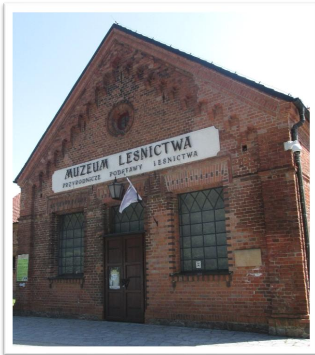
Powozownia (1854) - niegdyś pełniła funkcję stajni dla koni oraz wozowni - obecnie mieści się tu Muzeum Leśnictwa

Zwiedzanie Gołuchowa rozpoczęliśmy w Muzeum Leśnictwa z przewodnikiem. W starannie odrestaurowanych przez Lasy Państwowe obiektach Ośrodka Kultury Leśnej zwiedzaliśmy wystawy: „Dzieje Leśnictwa w Polsce”, „Kulturotwórcza rola lasu”, „Ochrona lasu”, „Spotkanie z lasem” i „Technika leśna”.