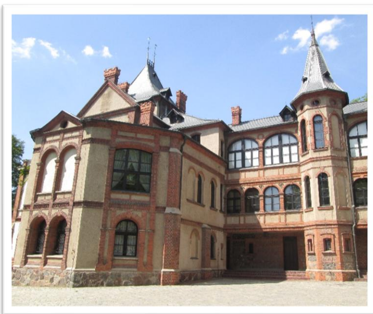
„Oficyna” obecnie Muzeum Leśnictwa

Szczególne wrażenie robi obiekt muzealny Oficyna zwany „małym pałacem”, który na wystrój i wyposażenie większości sal nawiązujące do epoki Izabeli i Jana Działyńskich.