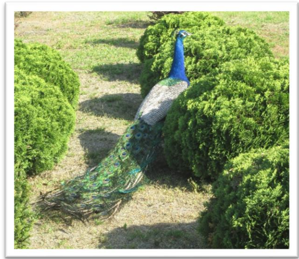
Pawie spacerujące w parku

Park-Arboretum to ponad 160 ha pięknej zieleni. Założony był przez hrabinę Izabelę Czartoryską w latach 1876-1899. Obejmuje blisko 600 gatunków drzew i krzewów, szczególnie okazy dendrologiczne, 262 drzewa o wymiarach pomnikowych. Hrabina widać bardzo park lubiła, skoro chciała być w nim pochowana.