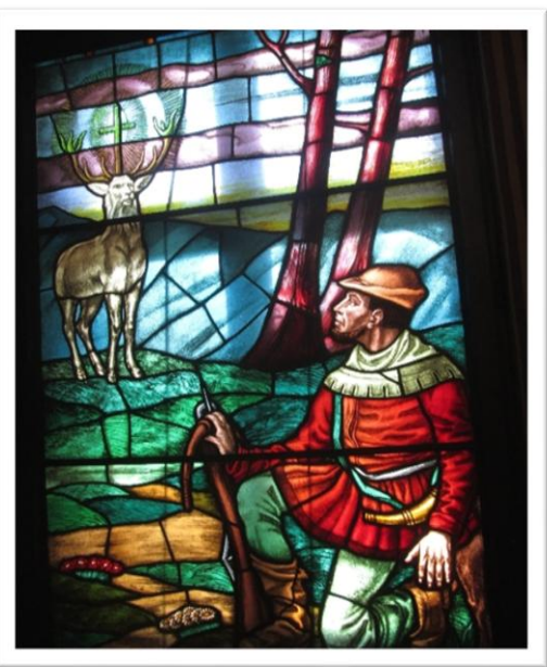
Witraż w oknie oficyny