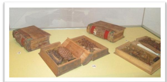
Zabytkowe księgi drzewne

Z wystaw szczególnie interesująca jest prezentowana w Owczarni „Technika leśna” pokazująca liczne maszyny i urządzenia stosowane w wielu dziedzinach gospodarki leśnej, takich jak: ochrona, hodowla, użytkowanie i urządzenie lasu.