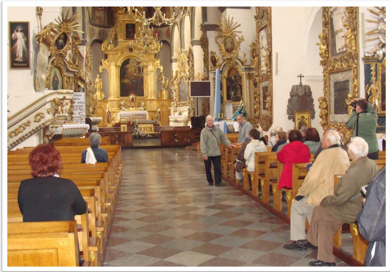
Bazylika kolegiacka Zwiastowania Najświętszej Maryi Panny w Pultusku z XV wieku