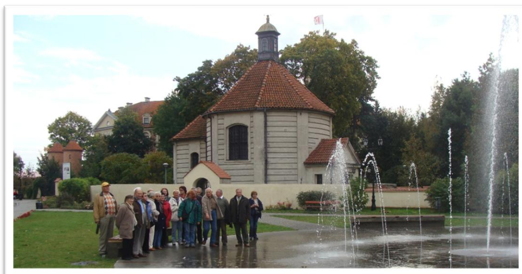
Zamek i kaplica św. Marii Magdaleny od strony Rynku w Pułtusku.