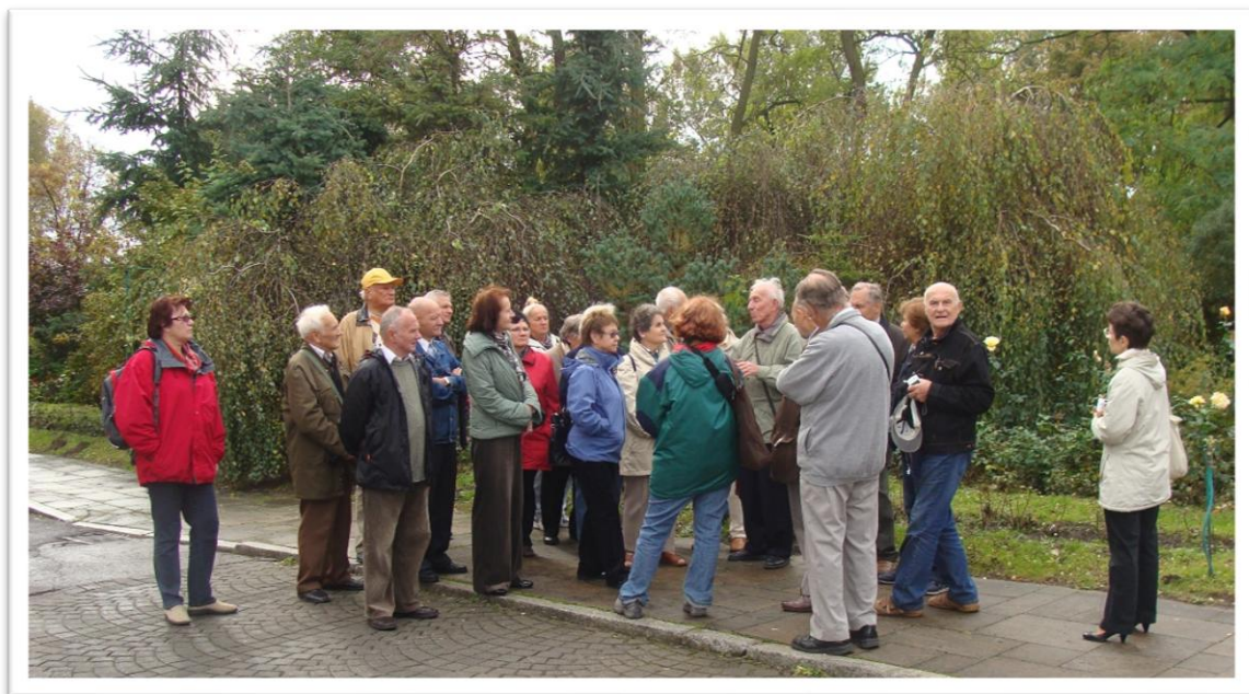
Spotkanie z panem przewodnikiem i pierwsze opowieści o Pułtusku

Relacja fotograficzna z wycieczki do Pułtuska i Nadleśnictwa Pułtusk.