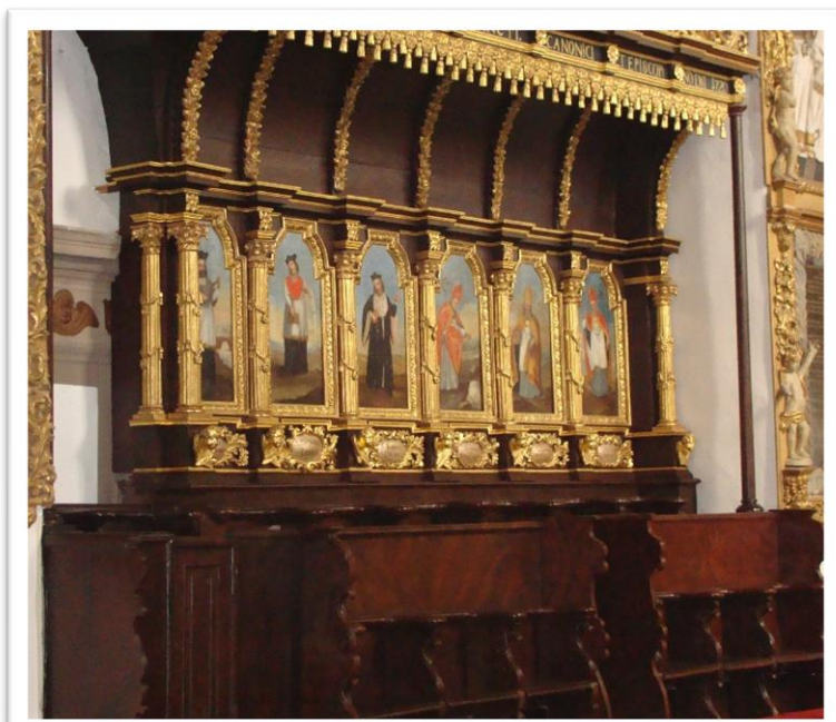
Wnętrze bazyliki pultuskiej ze sklepieniem kolebkowym wykonanym w latach 1554-1561