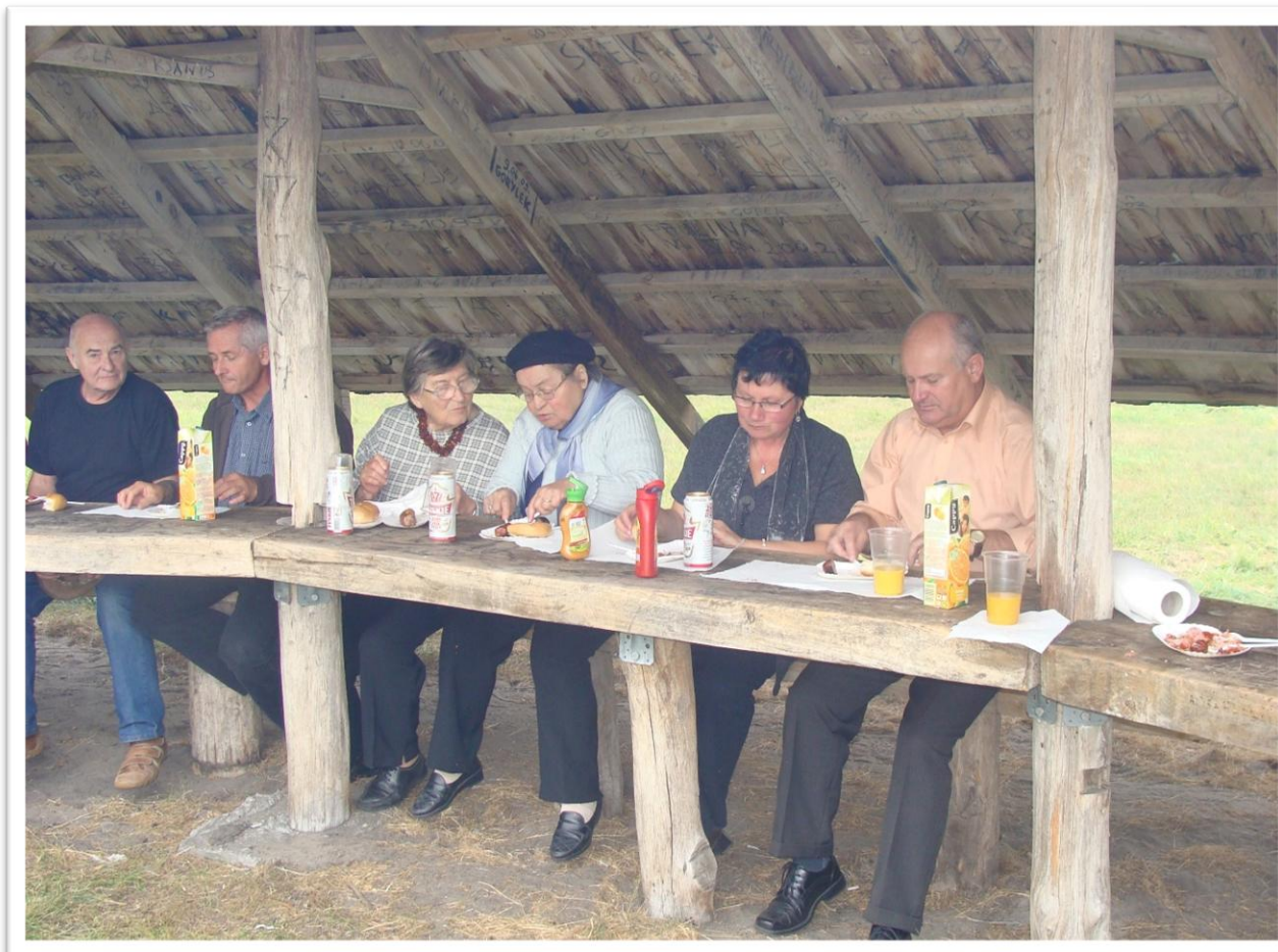
Uczestnicy wycieczki podczas konsumpcji kielbaski z grilla