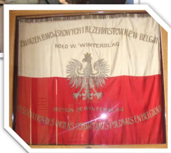
Zwiedzanie zamku, w którym obecnie mieści się Dom Polonii i Ośrodek Dokumentacji Wychodźstwa Polskiego (ODWP), który gromadzi zbiory i archiwa organizacji polonijnych.