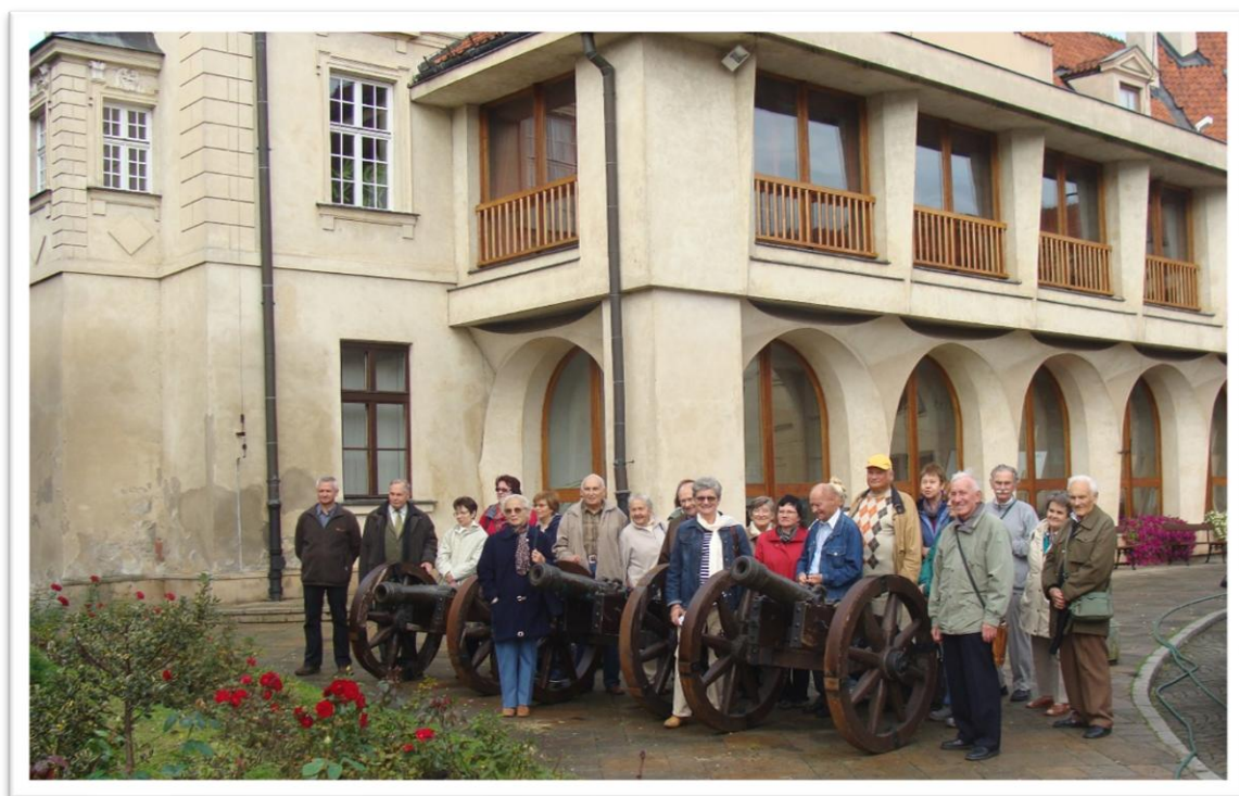
Uczestnicy wycieczki na dziedzińcu Zamku w Pułtusku

Zamek w stylu renesansowym, usytuowany jest na niewielkim wzgórzu nad Narwią na skraju Puszczy Białej