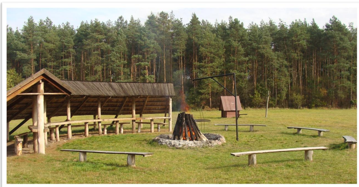
Przy ognisku w Nadleśnictwie Pultusk