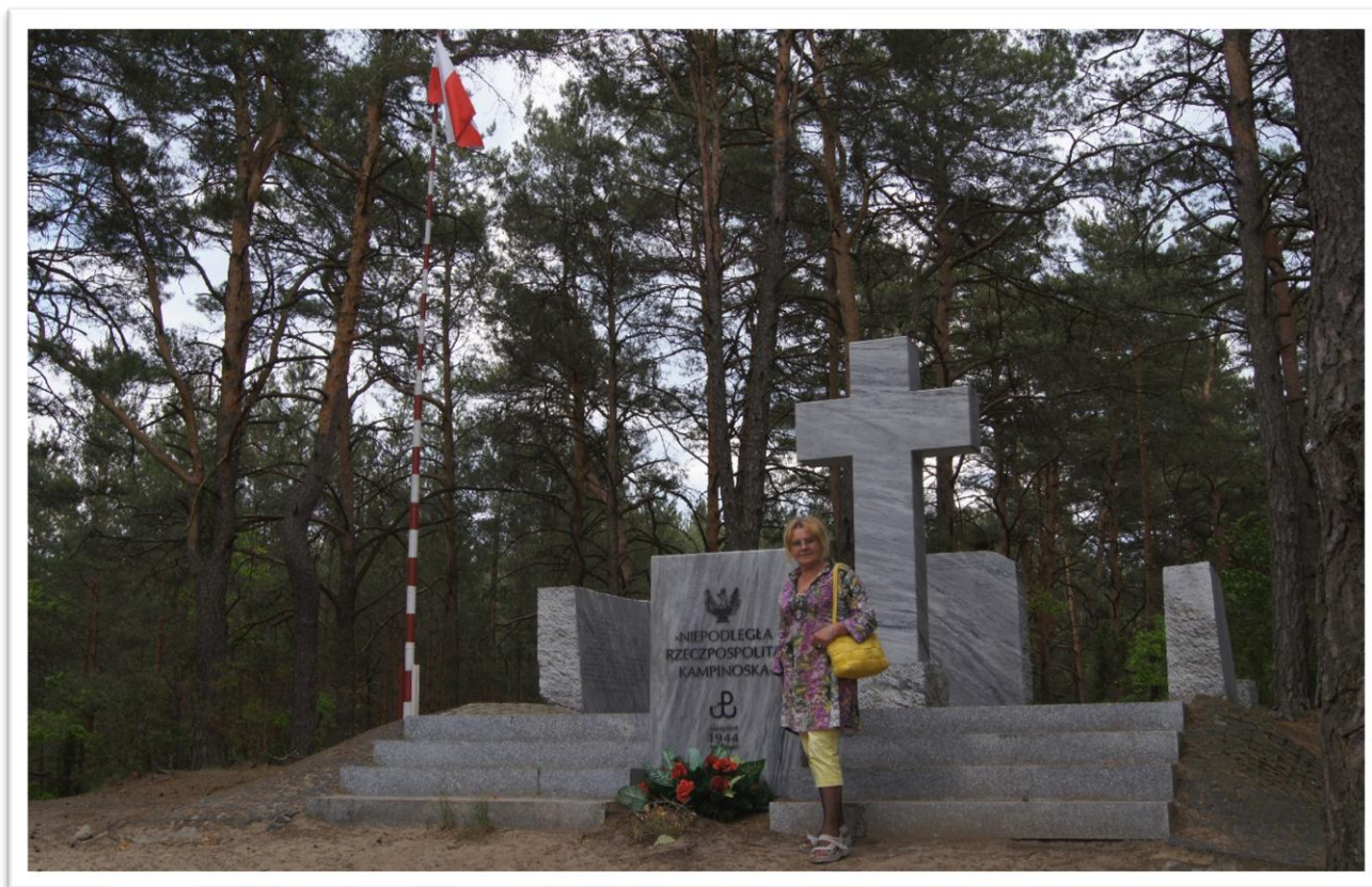
Pomnik Niepodległej Rzeczypospolitej Kampinoskiej i cmentarz partyzancki we wsi Wiersze, Gmina Czosnów. Na cmentarzu spoczywają żołnierze Grupy AK Kampinos

Dalsza droga prowadziła przez Czosnów do wsi Wiersze, gdzie w roku 1944 w okresie okupacji znajdował się rejon koncentracji Armii Krajowej Grupy „Kampinos”, ponad 3.5 tys. żołnierzy, których nazywano „Niezależną Rzeczpospolitą Kampinoską”. Między innymi z tego rejonu wychodziła odsiecz dla walczącej w powstaniu Warszawy.