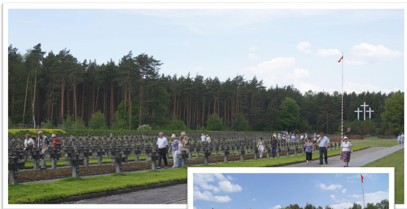
Cmentarz w Palmirach –miejsce pamięci narodowej z grobami 2 tysięcy Polaków, zamordowanych przez Niemców w czasie II wojny światowej

Na cmentarzu złożyliśmy kwiaty, a następnie w zadumie obejrzelśmy pamiątki zgromadzone w muzeum poświęconym tym tragicznym wydarzeniom.