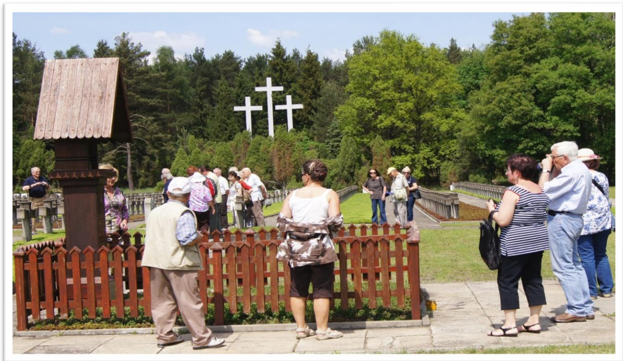
Grób Macieja Rataja – marszałka sejmu