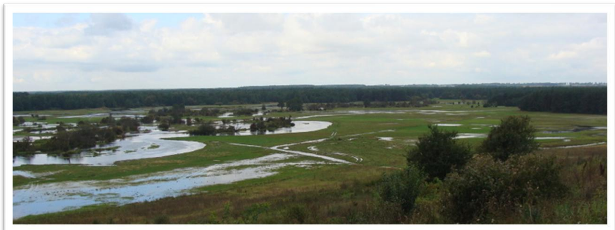
Panorama z miejsca widokowego na Sowiej Górze k. Węgrowa – meandry Liwca

Następnie zatrzymaliśmy się w punkcie widokowym na Sowiej Górze - najwyższym wzniesieniu w okolicy, z którego roztacza się piękny widok na płynący w szerokiej dolinie Liwiec oraz zabudowę Liwa z wieżami kościoła i czerwoną basztą zamku.