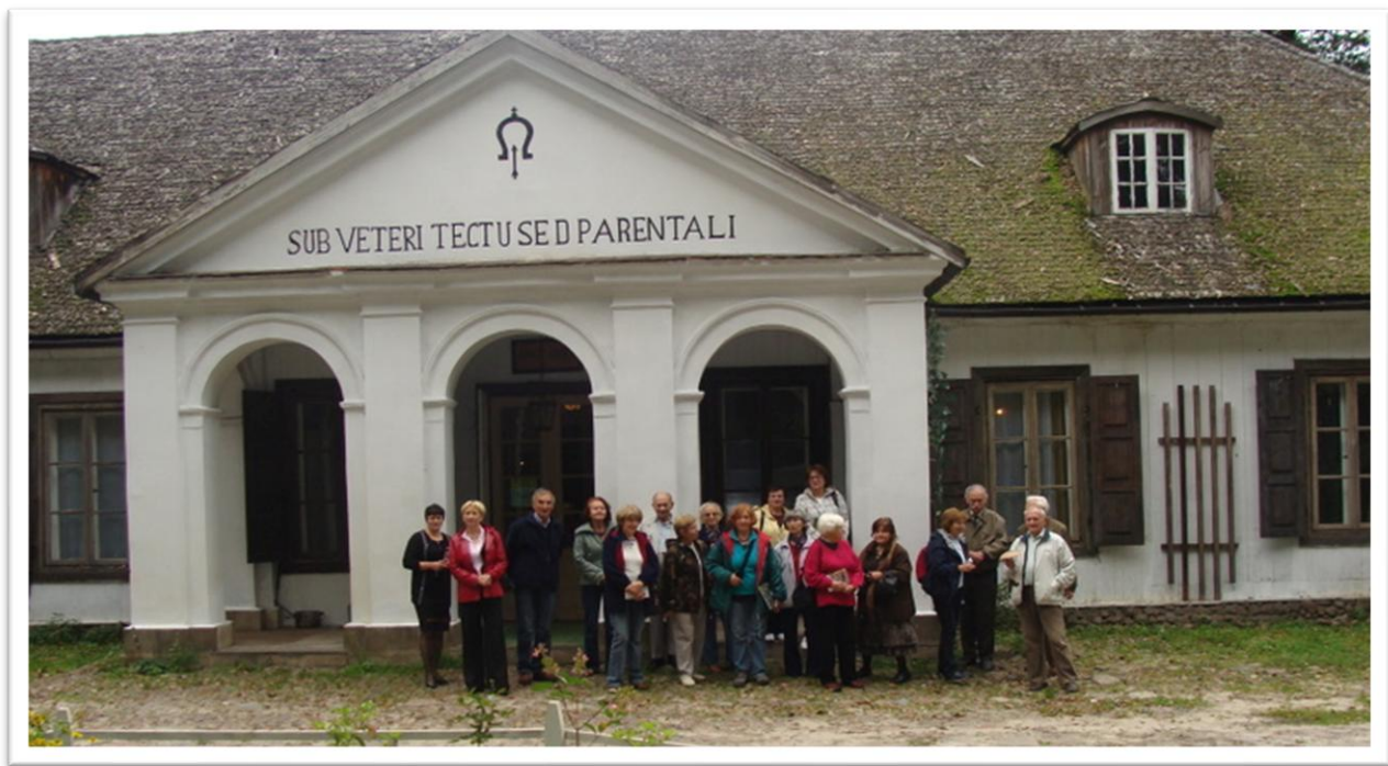
Muzeum Architektury Drewnianej Regionu Siedleckiego w Suchej

Program wyjazdu do Węgrowa obejmował zwiedzanie Muzeum Architektury Drewnianej Regionu Siedleckiego w Suchej , będące własnością byłego dyrektora Łazienek Królewskich w Warszawie - profesora Marka Kwiatkowskiego. Dużym nakładem środków i osobistego zaangażowania właściciela został odrestaurowany XVII-wieczny dwór, wykorzystywany aktualnie do powstawania filmów z tamtej epoki.