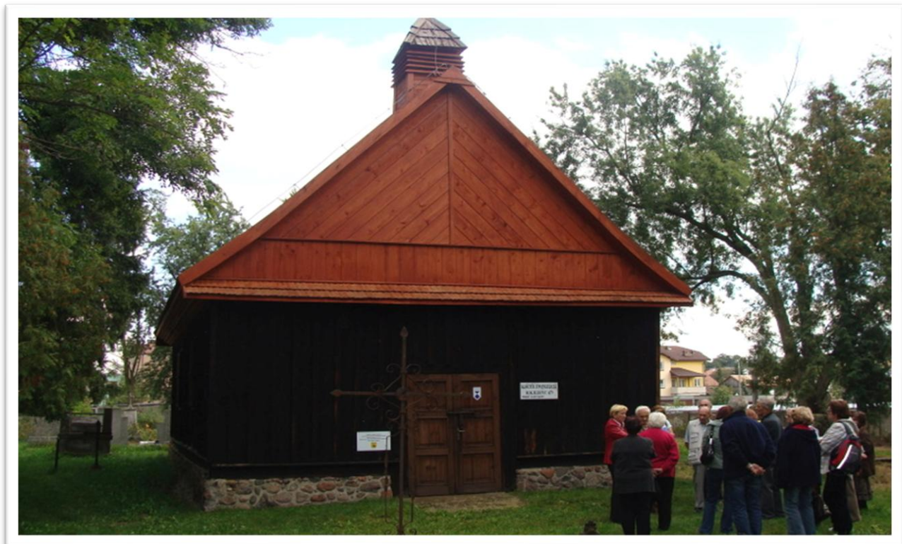
Kaplica protestancka z 1679 r. w Węgrowie

W Węgrowie zwiedziliśmy odrestaurowaną kaplicę cmentarną z 1679 roku - dawny kościół gminy prostackiej.