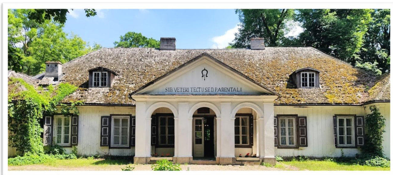
Muzeum Architektury Drewnianej Regionu Siedleckiego w Suchej

Program wyjazdu do Węgrowa obejmował zwiedzanie Muzeum Architektury Drewnianej Regionu Siedleckiego w Suchej , będące własnością byłego dyrektora Łazienek Królewskich w Warszawie - profesora Marka Kwiatkowskiego. Dużym nakładem środków i osobistego zaangażowania właściciela został odrestaurowany XVII-wieczny dwór, wykorzystywany aktualnie do powstawania filmów z tamtej epoki.