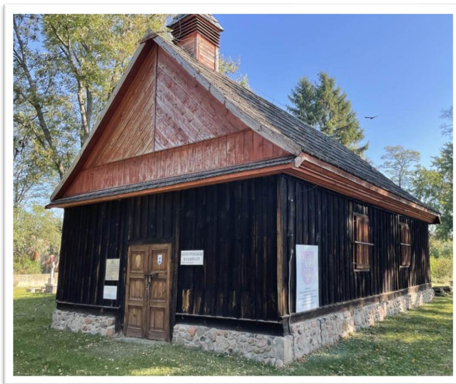
Kaplica protestancka z 1679 r. w Węgrowie

W Węgrowie zwiedziliśmy odrestaurowaną kaplicę cmentarną z 1679 roku - dawny kościół gminy prostackiej.