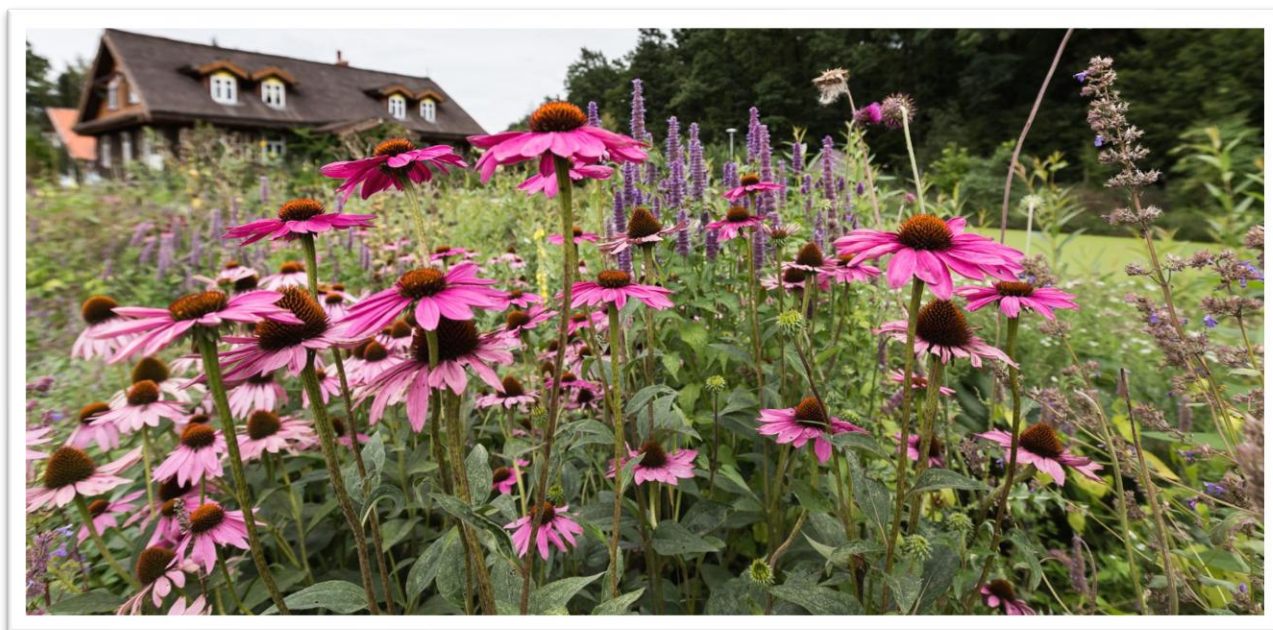
Jeżówka Purpurowa (Echinacea purpurea)

Przy każdym gatunku rośliny ustawiona jest tabliczka z polską i łacińską nazwą, zasięg jej występowania na świecie, od kiedy jest uprawiana oraz jak jest wykorzystywana i jakie ma działanie lecznicze.