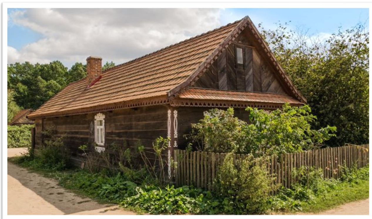
Chata Gospodarza - została zbudowana wyłącznie z naturalnych materiałów