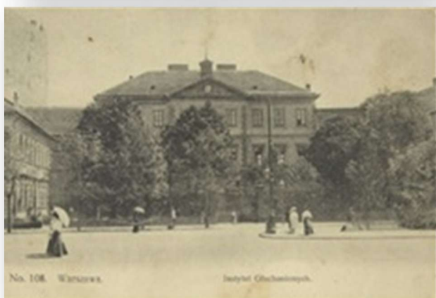
DŹS XII 8b/p.19/26

Stanisław Staszic był fundatorem i budowniczym pałacu zwanego teraz Staszicowskim. To on ufundował pomnik Mikołaja Kopernika, to on finansował z własnych środków ochronki, szpital Dzieciątka Jezus oraz Instytut Głuchoniemych w Warszawie. Ksiądz Stanisław Staszic był czołowym przedstawicielem polskiego oświecenia, filozofem, wybitnym politykiem, autorem nowoczesnej myśli edukacyjnej, wybitnym uczoneym z zakresu geologii geografii, działaczem społecznym. I nie bez przyczyny, po jego śmierci, młodzież studencka i lud Warszawy, w wielotysięcznym pochodzie, na własnych barkach nieśli