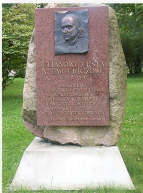
Julian Ursyn Niemcewicz