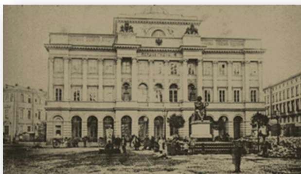
Pałac Staszica

Jak wszyscy dobrze wiemy, postać wielkiego patrioty, uczonego i społecznika nie miała w Warszawie przez przeszło 150 lat żadnego pomnika, jakby Warszawa nic temu człowiekowi nie zawdzięczała! A przecież ks. S. Staszic tak wiele dla stolicy zrobił. Był założycielem Warszawskiego Towarzystwa Przyjaciół Nauk, późniejszej Polskiej Akademii Umiejętności, był współzałożycielem Instytutu Agronomicznego na Marymoncie, Instytutu, od którego Szkoła Główna Gospodarstwa Wiejskiego wywodzi swoje korzenie.