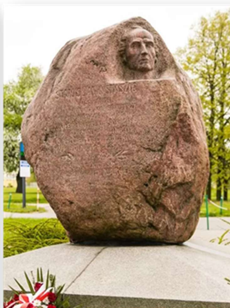
ks. Stanisław Staszic

Dlaczego naokoło tyle obojętności w tej sprawie? Dlaczego nikt nie chce podjąć decyzji, aby jedyny pomnik księdza Stanisława Staszica w Warszawie znów był udostępniony mieszkańcom Stolicy? Dlaczego mamy ulegać i tolerować beczynność i ignorancję biurokratów ze stołecznego Ratusza w podejmowaniu banalnie prostych i nieskomplikowanych decyzji? Dlaczego pomnik wielkiego myśliciela i patrioty, autora „Przestróg dla Polski”, który całym życiem udawał co to znaczy „ pro publico bono ” musi spoczywać pod płachtą brezentową już dwa i pół roku?